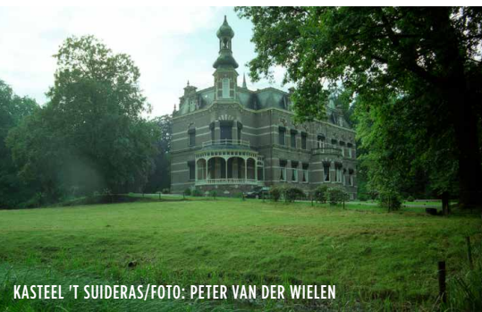
KASTEEL 'T SUIDERAS

Vanaf knp 50 naar 90. Bij 91 voor bezoek aan Suideras even 200 meter rechtdoor. Daarna terug en vervolgens naar 87, 88. Hierna passeert u Hackfort op weg naar 89 in Vorden. Hier even de knooppuntenroute verlaten voor een bezoek aan kasteel Vorden (ong. 500 m). Ga hiervoor rechtdoor tot aan rotonde, schuin rechts ziet u het kasteel. Na bezoek terug naar 89 en dan naar 86. Vervolgens naar 81 waar u langs Den Bramel en Enzerinck komt. Let op! Na Enzerinck verlaat u de knooppuntenroute op de driesprong. Ga hier rechtsaf en volg de Heyendaalseweg tot knooppunt 82, waar u rechtsaf gaat naar nummer 85. Vervolgens 56, 63 en 62. U gaat langs De Kieftskamp naar 93 waar u ook rechtsaf naar kasteel Vorden kunt gaan (ong. 700 m.) Op dit punt verder naar 94 en dan naar 92.