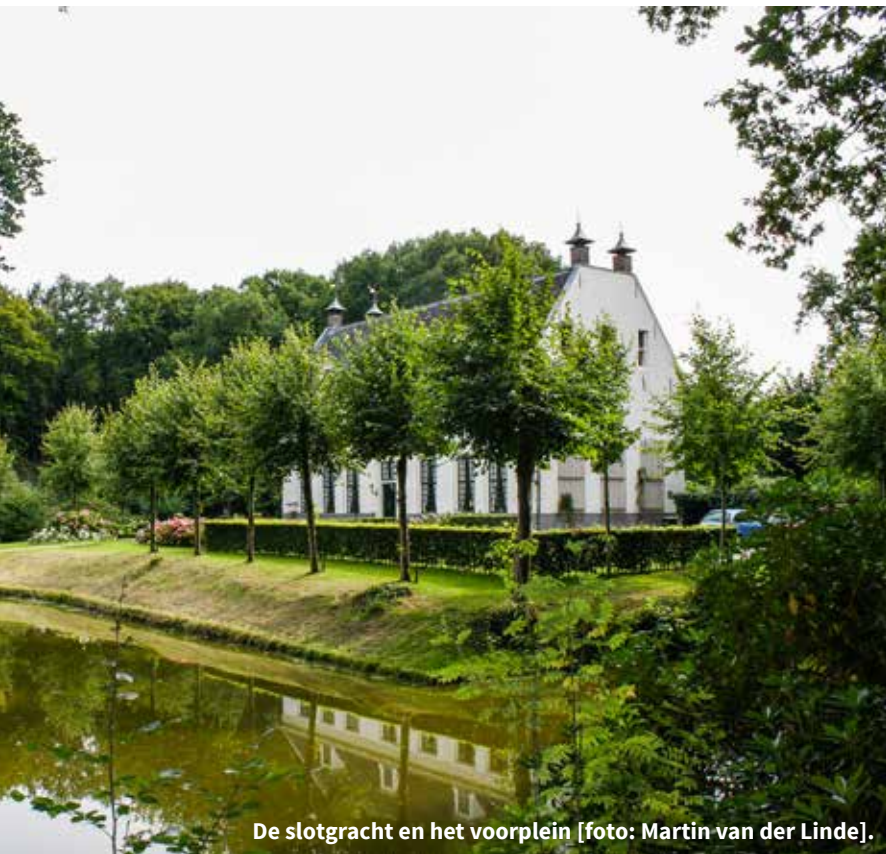
De slotgracht en het voorplein.