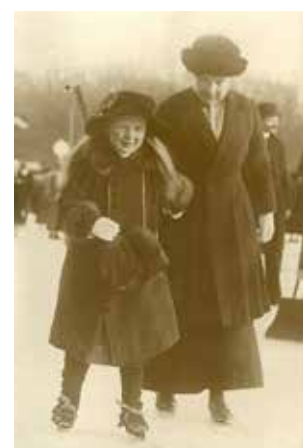
Boven: Isabella Sloet en prinses Juliana op de schaats, ca. 1917. Herkomst foto: Jan Wester, gebruikt voor tentoonstelling Vollenhove en de koninklijke hofhouding in Stadsmuseum Vollenhove (2000).

Het gebied was daarnaast, mogelijk door de herkenbaarheid van de grote meren vanuit de lucht, onderdeel van een aanvliegroete van geallieerde en Duitse gevechtsvliegtuigen. Zo'n 25 vliegtuigen