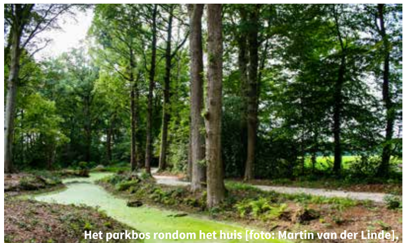
Het parkbos rondom het huis.