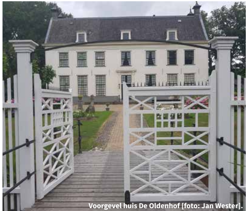
Voorgevel huis De Oldenhof.