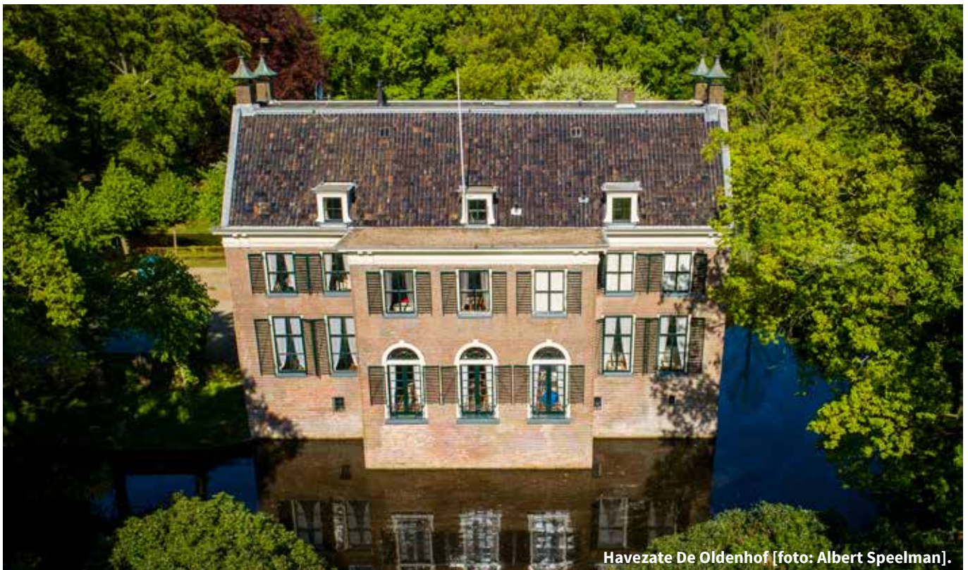
Havezate De Oldenhof.

Kastelen en buitenplaatsen vragen om aangepast beheer op maat. Verhalen van deze plekken delen met geïnteresseerd publiek – dat hoort steeds meer bij het beheer van nu. Daarom doet havezate De Oldenhof, gelegen net te zuiden van het stadje Vollenhove, mee aan het onderzoek van de Nederlandse Kastelenstichting naar de periode 1940-1945.