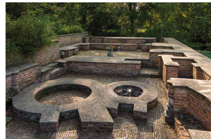
De opgemetselde fundering van de paleisvleugel van Gruuthuuse.