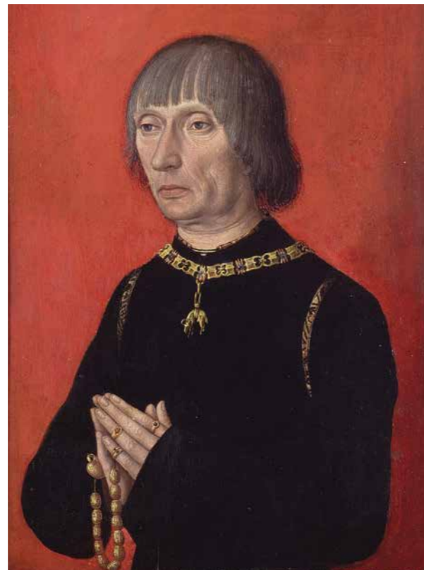
Lodewijk van Gruuthuse, geportretteerd door de Meester van de vorstenportretten, rond 1480, Gruuthusemuseum Brugge