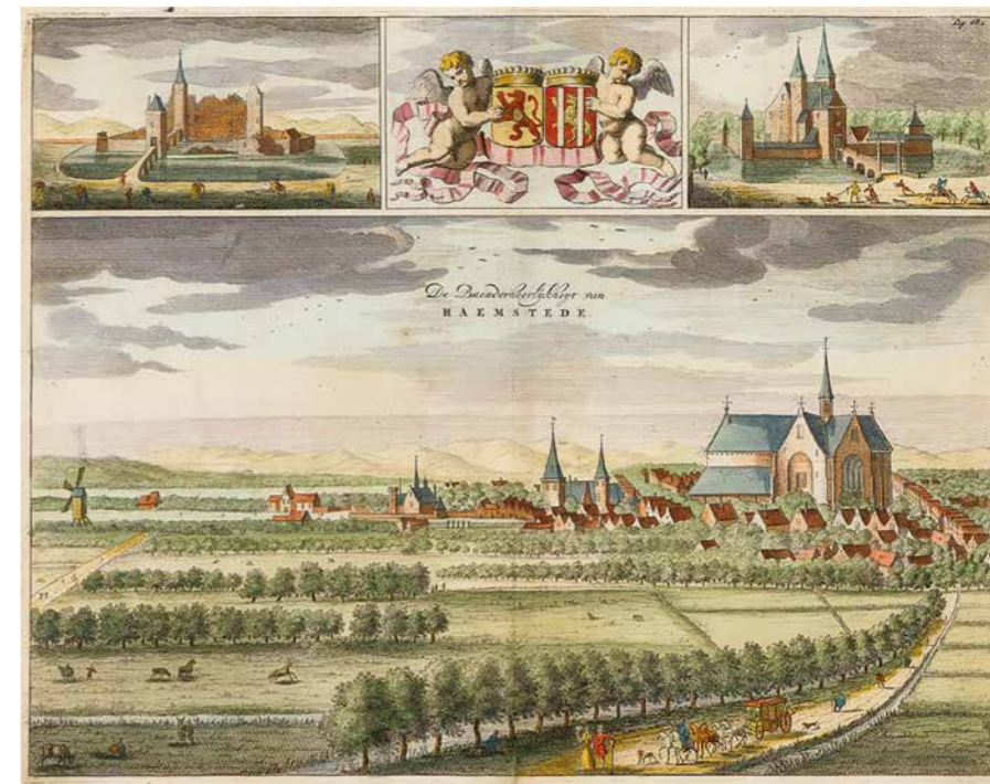
De Baanderheerlijkheid Haamstede door M. Smallegange, 1696. Links naast de kerk zijn de torens van het kasteel zichtbaar, rechtsboven het slot

Deze herfst verschijnt in de serie kasteelmonografieën van de Nederlandse Kastelenstichting een herziene uitgave over kasteel Haamstede. Nieuwe inzichten leveren een fascinerend beeld op van de laatmiddeleeuwse hoogtijdagen van dit kasteel, dat ooit tot de meest indrukwekkende van ons land behoorde.