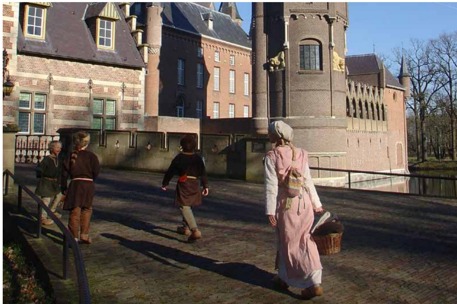
KASTEEL HEESWIJK MET RE-ENACTORS.

buitenplaatsen de afgelopen tijd op allerlei manieren extra hard gewerkt aan een veilige manier van openstelling. Er zijn looproutes aangelegd en aanvullende hygiënemaatregelen getroffen, zoals het inrichten van desinfectiepunten.