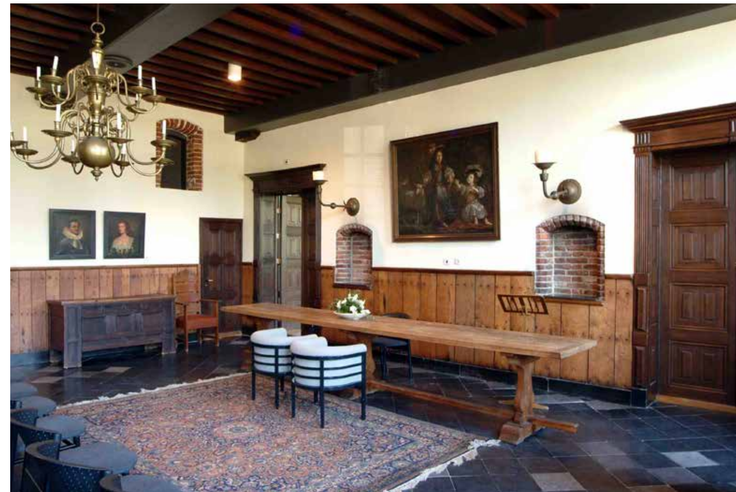
INTERIEUR KASTEEL WIJCHEN.

Bezoekers komen naar kastelen en buitenplaatsen om het landgoed te bezichtigen, voor het gebouw zelf, met of zonder rondleiding, maar ook voor tentoonstellingen, concerten, huwelijken en andere evenementen.