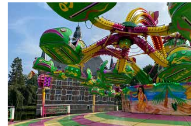
KERMIS IN DE TUIN VAN KASTEEL WIJCHEN.

Voornoemde voorbeelden tonen immers aan dat de pandemie ook heilzame nieuwe inzichten en initiatieven oplevert. Zo is een ramp een ramp, maar laten kastelen en buitenplaatsen zien zelfs in barre omstandigheden weerbaar te kunnen zijn.