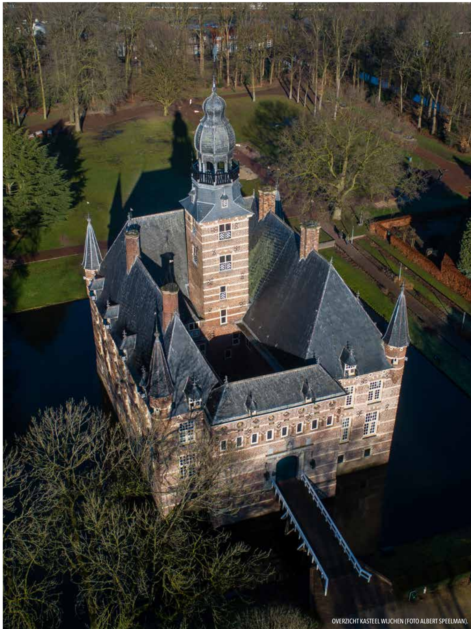
OVERZICHT KASTEEL WIJCHEN.