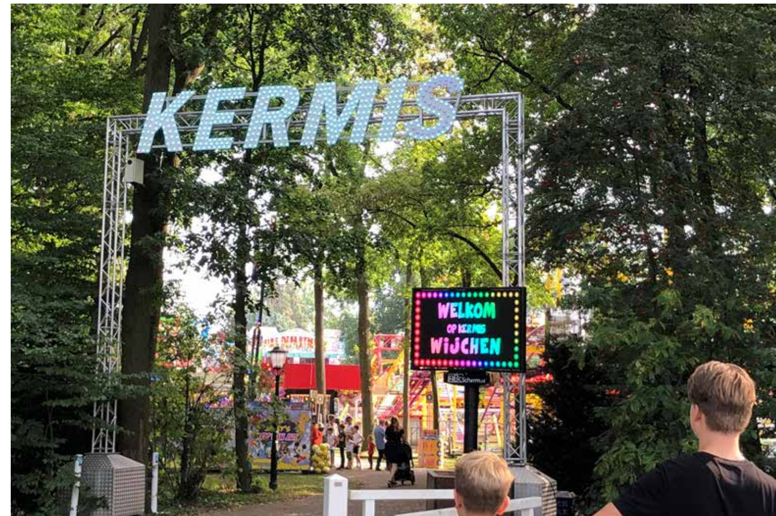
KERMIS IN DE TUIN VAN KASTEEL WIJCHEN.