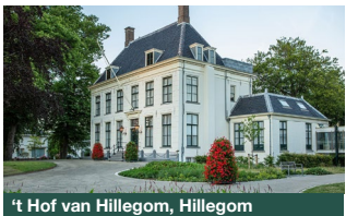
t Hof van Hillegom, Hillegom