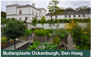
Buitenplaats Ockenburgh, Den Haag

Op maandag 20 mei, Tweede Pinksterdag, is het Dag van het Kasteel. 23 kastelen, landgoederen en buitenplaatsen (of restanten hiervan) in de landgoederenzone van Zuid-Holland openen de deuren voor het publiek met een gevarieerd activiteitenprogramma voor jong en oud. Volg verrassende rondleidingen, bekijk oude ambachten, geniet van muziek of verhalen en nog veel meer! Iedere deelnemende locatie heeft een uniek programma. Kijk voor de activiteiten, tijden en bereikbaarheid op: www.dagvanhetkasteel-zh.nl