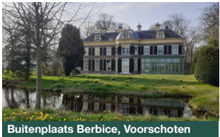
Buitenplaats Berbice, Voorschoten