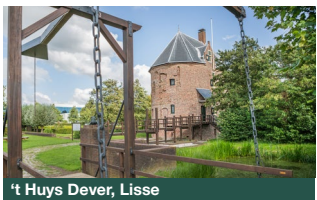
t Huys Dever, Lisse