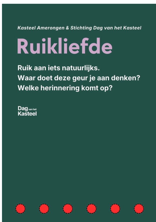
Eén van de vijf hoofdborden

Alle middelen worden ontworpen in één consistente Canva-stijl. Kaartjes zijn eenvoudig verwisselbaar en kunnen met metalen ringen aan het hoofdbord worden bevestigd.