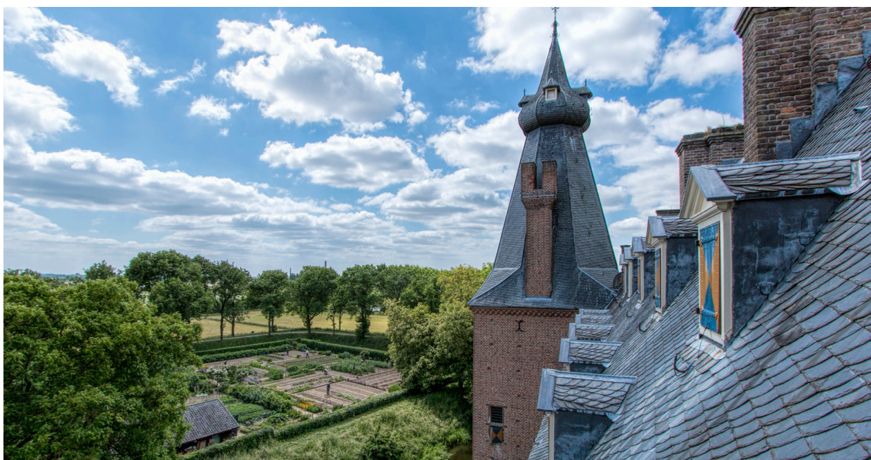
Moestuin van Kasteel Doorwerth. @KasteelDoorwerth