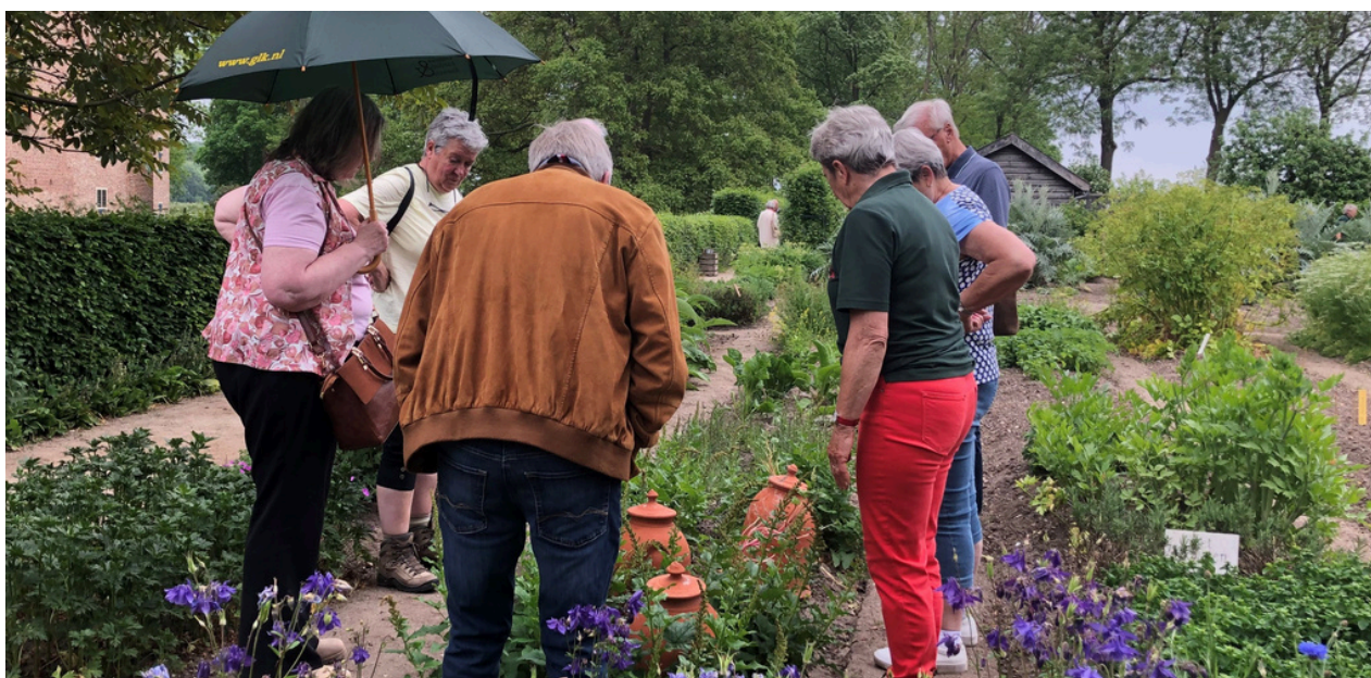
Kasteel Doorwerth rondleiding @Kasteel Doorwerth