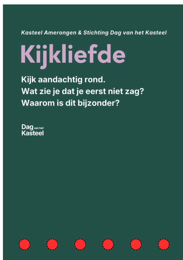
Eén van de vijf hoofdborden