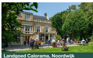
Landgoed Calorama, Noordwijk