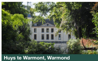
Huys te Warmont, Warmond