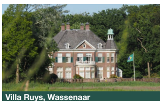
Villa Ruys, Wassenaar