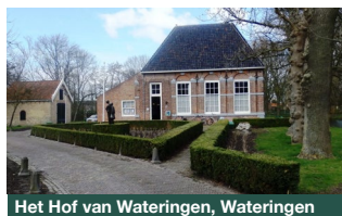
Het Hof van Wateringen, Wateringen