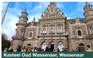
Kasteel Oud Wassenaar, Wassenaar

Dag van het Kasteel is een landelijk evenement dat wordt georganiseerd door Stichting Dag van het Kasteel. Kijk op www.dagvanhetkasteel.nl voor een overzicht van alle deelnemende locaties in Nederland.