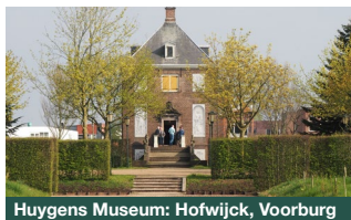
Huygens Museum: Hofwijck, Voorburg