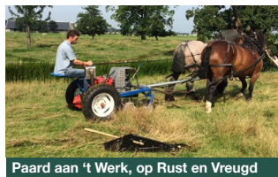
Paard aan 't Werk, op Rust en Vreugd