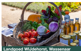
Landgoed WJdehorst, Wassenaar